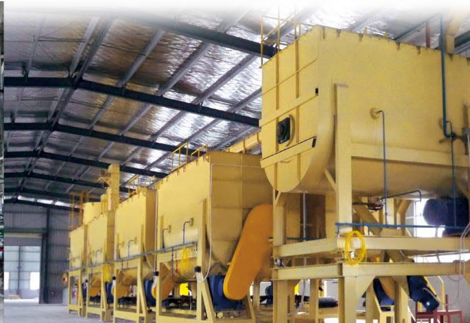
■同體發酵飼料生產設備