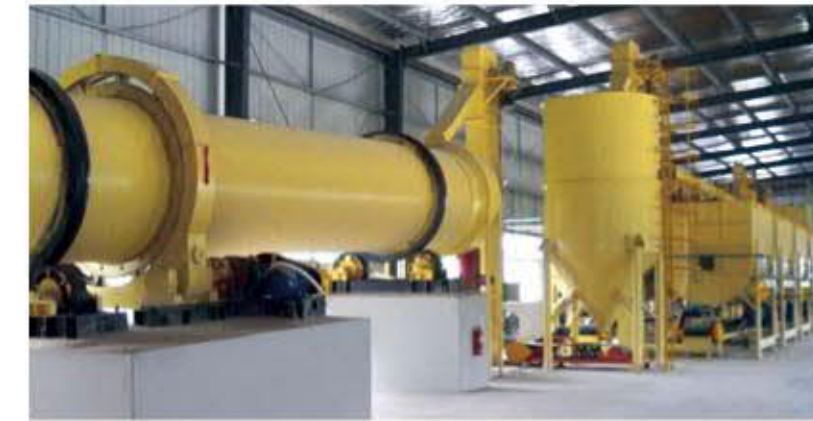
■左下圖：有機飼料發酵設備 ■右下圖：有機酵素培養設備

為推動「綠色養殖」與「無公害養殖」環境，讓人類能更健康的獲得無害無抗的環保綠色食品，大中生技特別在湖北天門設廠作為首處推廣基地。採用先進自動化設備，生產「大力肥有機飼料」，對原物料與生產進行嚴格的品質管控，並對生產流程進行嚴格監督管控，為了讓產品品質安全的推向市場，我們採用先進的化驗檢測設備，層層把關進行嚴格檢測。期望我們能為廣大的養殖事業盡一份心力，讓地球更環保，人類更健康。