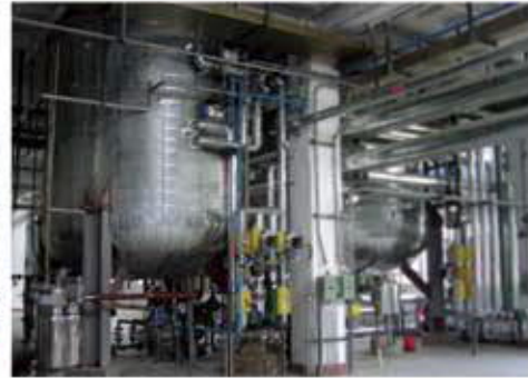
■ 左圖：樹脂反應全廠 ■ 右圖：環氧樹脂設備