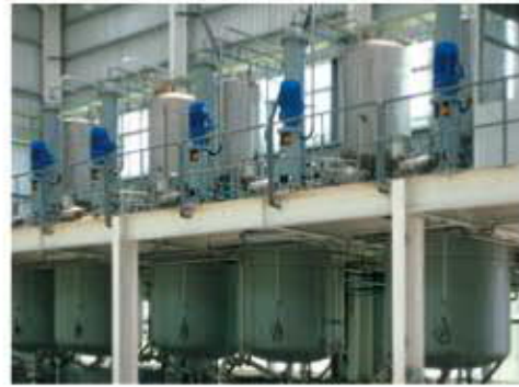
■ 樹脂反應整廠設備

我們提供整廠輸出、設計服務、生產線總包、工廠改建、專案管理諮詢服務、擴建服務、方案設計服務，徹底解決生產樹脂與油漆廠等民生化工難題。