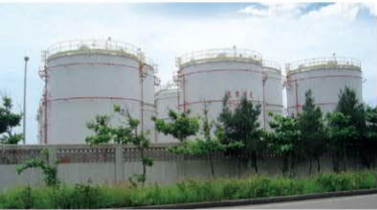
■左下圖：生質柴油設備 ■右下圖：原料儲槽

近年來，全球不遺餘力推動再生能源。台灣在經濟部發展綠能源—生質燃油執行方案推動下，從第一階段綠色公車、第二階段綠色城鄉，第三階段全面實施市售柴油添加1%生質柴油，第四階段則是將添加比例提高至2%，將達成「生質柴油利用達10萬公秉」發展目標。我們掌握市場需求，並透過台灣工業技術研究院技術轉移，已具有自行整合生產生質柴油整廠設備的實力和具體成果。除提供市場需要及相關綠能投資的獲利機會，亦帶動各國對生質能源整廠設備需求的持續成長。