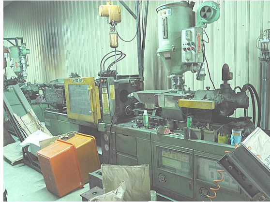
樺欽 HC150 x1 台