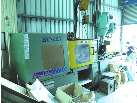
樺欽 HC125 x2 台