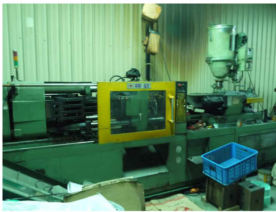
樺欽 HC200 x1 台